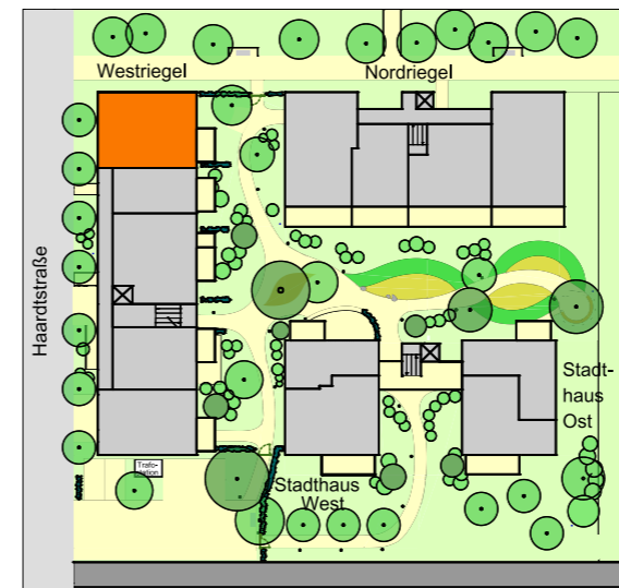
Lageplan 2.OG M 1:1000